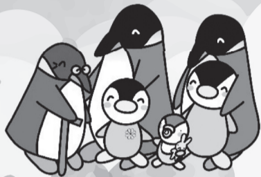
ミンジー (民生児童委員イメージキャラクター)