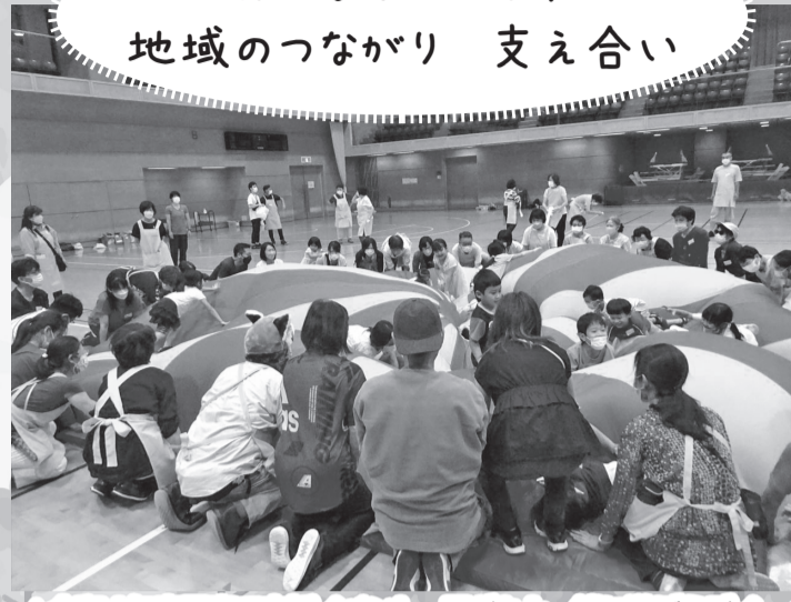
▲令和4年度子育て支援イベント～子どもと一緒に遊ぼうデー～の様子

凡例 ※費用の記載がないものは無料 ☎お問い合わせ(申込)先 HPホームページ Eメールアドレス