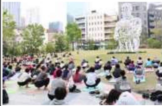
地域活性化・にぎわい形成の一環として民間事業者が実施したヨガイベントの事例（虎ノ門ヒルズ/港区） 出典2