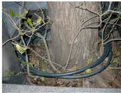
大規模コンベンションセンターにおいてトイレ洗浄水、屋上融雪、植栽灌水、冷却水、防災用上下水の交換水と雨水利用の複合を行っている事例（東京国際フォーラム事例）