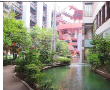
大規模商業施設で修景利用（運河）している事例（チャンネルシティ博多） 出典 1