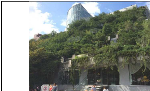
大規模公民複合施設においてトイレの洗浄水や植栽散水に利用している事例（アクロス福岡） 出典 1