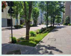
雨庭整備イメージ

国土交通省総合政策局環境政策課では、重点支援団体としてグリーンインフラに取り組む地方公共団体3地域を決定しました。重点支援団体に対しては、コンサルタントや専門家の派遣等を通じて、計画づくりや推進体制の構築等を支援し、官民連携によるグリーンインフラの実装を加速します。