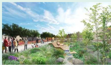
グリーンインフラ実装 イメージ

神奈川県横浜市で開催する2027年国際園芸博覧会は、「幸せを創る明日の風景」をテーマに、花や緑との関わりを通じ、自然と共生した持続可能で幸福感が深まる社会の創造を目的としています。