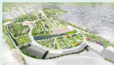
博覧会会場 イメージ