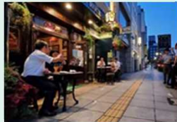
歩道を活用した賑わい創出

いなべ市 (三重県) 令和元年5月に、もともと放置された雑木林であった地形を生かして、自然環境を活かしたまちづくり拠点「にぎわいの森」をオープン。昨年は、「いなべ市グリーンインフラ推進協議会」を設立し、グリーンインフラを市内で展開するための産官学金の連携体制を構築した。今後、にぎわいの森の整備効果を踏まえ、柔軟な資金調達手法を活用した新規事業の立ち上げを目指す。