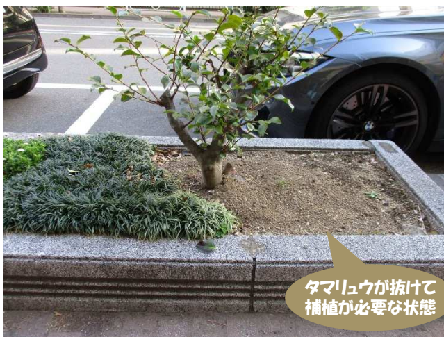
タマリユウが抜けて補植が必要な状態

花咲く街角花壇のほとんどは設置後かなりの年数が経過し、花壇施設や土壌の劣化などが見られます。順次、花壇等の更新を行う必要がありますので、土の交換やすきとり、花壇内の地被類や低木の補植等が必要な箇所がありましたら、下記までご連絡をお願いします。 また、引き続き、花壇ボランティアをされる方を募集中です！