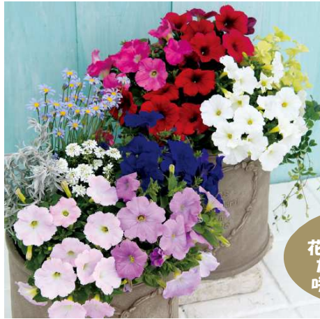
小まめに 花がらを摘んで たくさん花を 咲かせましょう