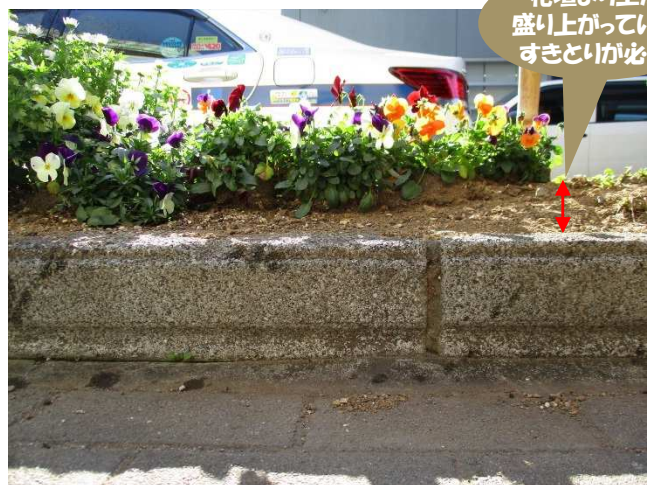
花壇より土が盛り上がっているすきとりが必要