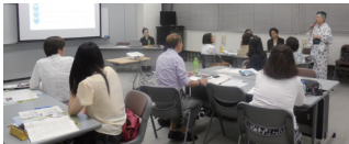
7月17日の オリエン テーション にて