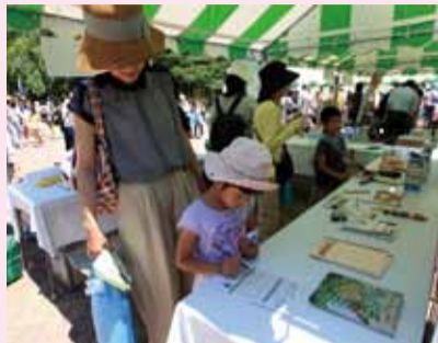
▲エコマーククイズの様子

ることで、持続可能な社会の実現を目指しています。ブース内は、エコマーククイズに挑戦する家族連れで賑わっていました。