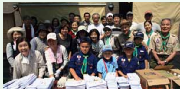
▲湊一丁目町会の皆さん

クリーンデーの参加者の3割がそうした方たちです。新旧住民がうまくつながっているのではないのでしょうか。お祭りなどの行事にも率先して参加してくれる方が多い町ですよ」と笑顔でした。