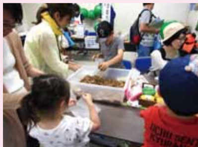
▲サシェ作りの様子

所有林の管理を行っている会社です。エコまつりでは、森の香りを持ち帰っていただきたいと、ヒノキのチップを詰めたサシェ(香り袋)のワークショップを実施し、楽しくサシェ作りに励む子どもとお母さんの姿が見られました。