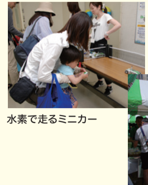
水素で走るミニカー

「中央区の森コーナー」で行われた、「丸太切り体験と間伐材を使ったコースター・ドアップレット作り」も子どもたちに大人気。中央区の森がある「檜原村物産コーナー」では、