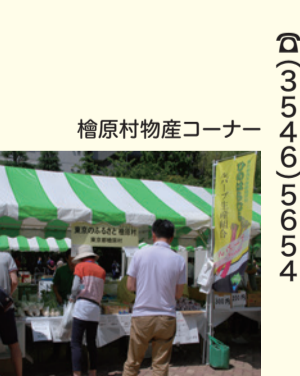
檜原村物産コーナー