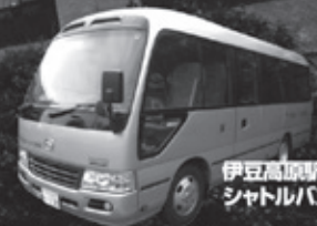
伊豆高原駅から シャトルバス運行中

入湯税別途頂きます(6歳以上150円)。12/31~1/2は追加料金が発生します(一律800円)。 共用部と客室と洋室(3室)は、バリアフリー対応となります。