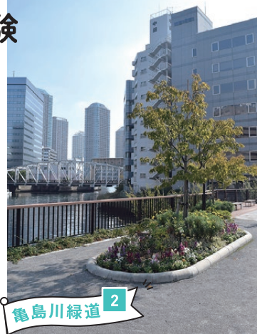
四季の草花を楽しみつつ散策できる親水遊歩道。南高橋や佃の高層マンション群も見られます。