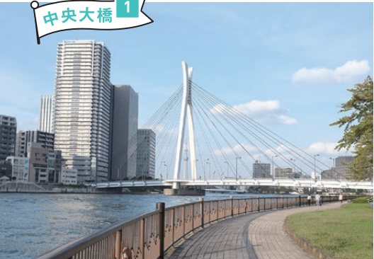
主塔のイメージは卵の鉄形(角)。北側歩道にはパリ市から贈られたメッセンジャー像があります。