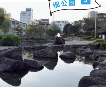
公園の正体はスーパー堤防。石川島燈台のモニュメントや「和」をモチーフにした広場があります。