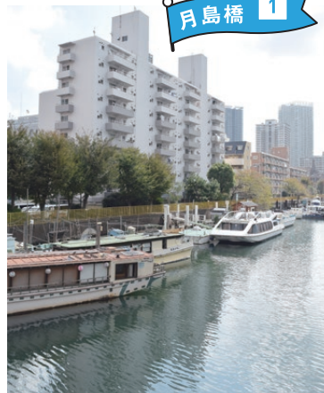
月島橋からは多くの屋形船や釣り船が眺められます。運河からは潮の香りも漂っています。