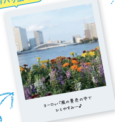
ヨーロッパ風の景色の中でひとやすみ…♪