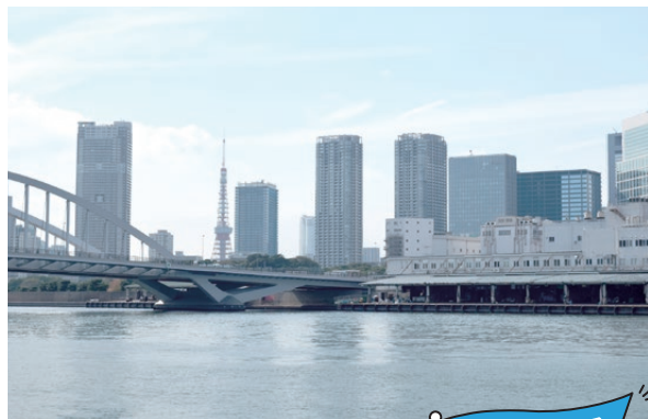
隅田川テラスからは旧築地市場と開通した際の築地大橋という築地の歴史が目に入ります。