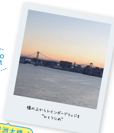
橋の上からレインボーブリッジを“ひとりじめ”