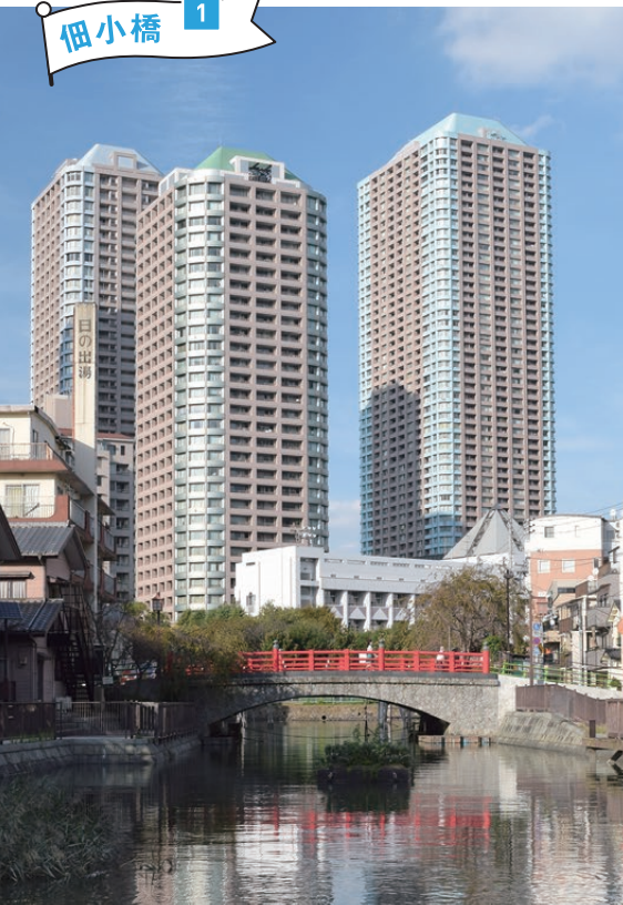
朱色の欄干が際立つ佃小橋とリバーシティの高層マンション。古風な趣とシティライフがミックスしています。