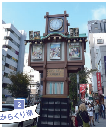
人形町からくり鐘 2

江戸情緒を人形たちが楽しく伝える、人形町商店街のモニュメント。大通りを挟んで2基あります。