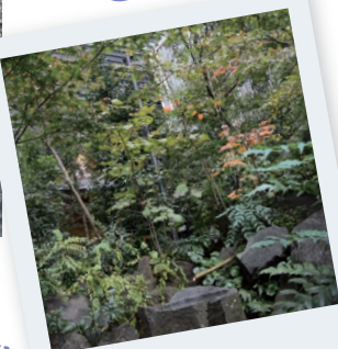
ビルに囲まれた「和の空間」

4 「くすりのまち」日本橋本町界限には多くの製薬会社があり、神社には医薬の租神が祀られています。