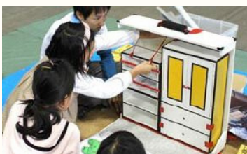
家具転倒防止ワークショップ