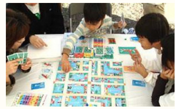
防災すごろく 「GURAGURA TOWN」