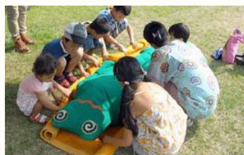
毛布で担架タイムトライアル