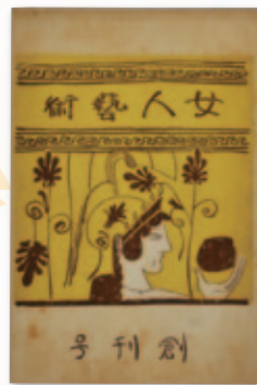
『女人芸術』創刊号 [前期] 大正12年(1923) 女人芸術社