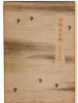
『旧聞日本橋』 昭和10年(1935) 岡倉書房