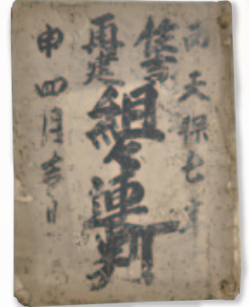
住吉神社古文書 「住吉再建組々連判」 天保7年(1836) (住吉神社蔵)