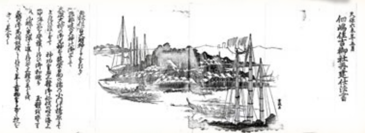
住吉神社「佃嶋住吉御社再建仕法書」版木 (住吉神社蔵)