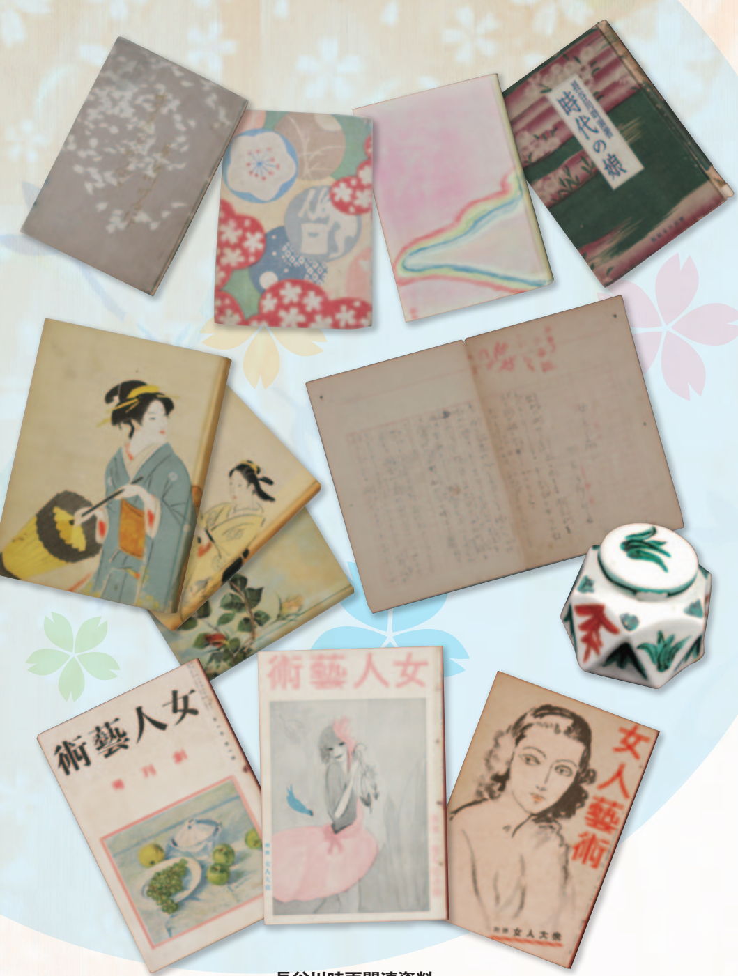
長谷川時雨関連資料