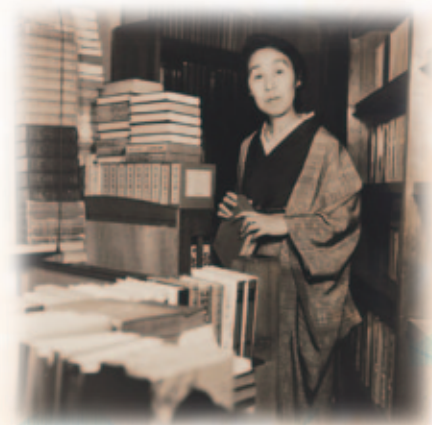
長谷川時雨 昭和13年(1938) ごろ