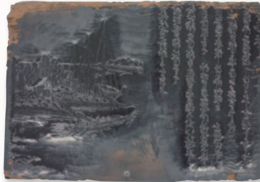
住吉神社「佃嶋住吉御社再建仕法書」版木 天保6年(1835) (住吉神社蔵)

東京都中央区明石町12番1号 中央区保健所等複合施設6階 TEL 03 (3546) 5537