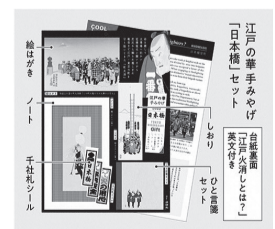
江戸の華 手みやげ「日本橋」セット(京はし満津金)