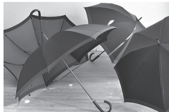
東京洋傘(小宮商店)