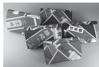
千社札ふるしきグッズ名刺入れ(中央区観光協会)