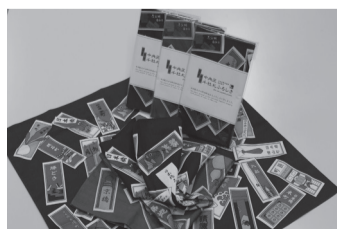
千社札ふるしき3色(中央区観光協会)